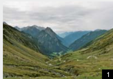
Abb. 1: Die Greina-Hochebene

Mit Ihrer Unterstützung setzen sie sich auch für die Achtung der Volksabstimmungen bei der Umsetzung der verfassungskonformen Restwassermengen ein.