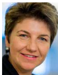
NR Viola Amherd, CVP/VS