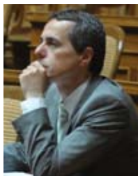
NR Dr. Ignazio Cassis, RL/TI