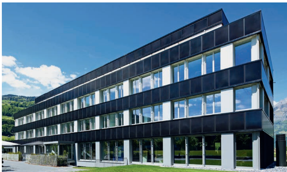
Abb. 3: Dieser Verwaltungsbau in Flums/SG konsumiert seit der Sanierung mit 99'000 kWh/a 71 Prozent weniger als vorher (340'000 kWh) und produziert dazu noch 114'000 kWh/a.

Heute können auch Mehrfamilien-, Industrie- und Gewerbebauten in PEB verwandelt werden. Der sanierte Verwaltungsbau der Flumroc AG in Flums/SG z.B. konnte seinen Energiebedarf von 340'000 auf 99'000 kWh/a reduzieren (Abb. 3). Dank gut integrierten Solaranlagen auf dem Dach und an den Fassaden produziert er 114'000 kWh/a – 15% mehr, als er im Jahresdurchschnitt braucht. Machen wir unsere Gebäude zu ästhetisch ansprechenden PEB und realisieren wir die Energiewende, ohne unsere letzten freien Fließgewässer zu zerstören (Abb.4)!