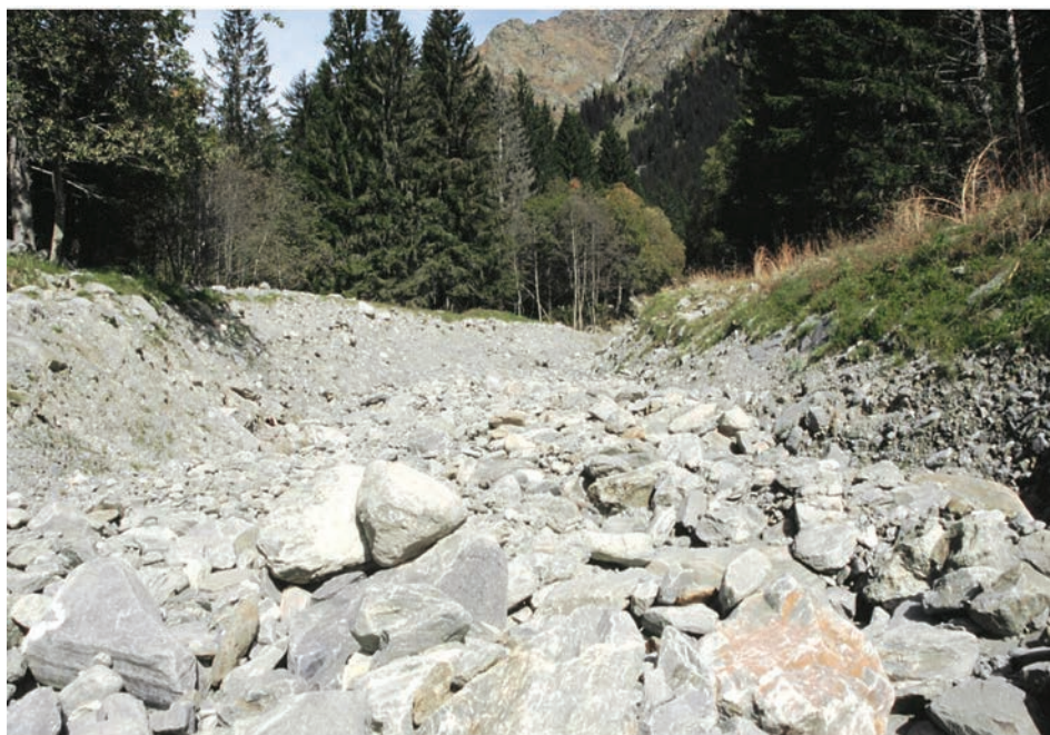
Abb. 1: Ein trocken gelegter Seitenbach der Moesa südlich des San Bernardino/GR. Die Axpo plant auch eine KWKW-Erweiterung in der Moesa zwischen Cama und Sorte, einem Wildwasserabschnitt.