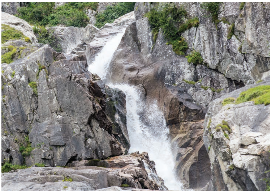
Abb. 4: Schäumend fällt das Wasser des Rein da Sumvitg an der Frontscha unterhalb der Greina-Hochebene in die Tiefe, bevor der Fluss von der NOK/Axpo vollständig trocken gelegt wird.

Trockene Flussbette sind doppelt tragisch, weil es eine viel ökologischere und ökonomischere Alternative gibt. Alle neuen KWKW