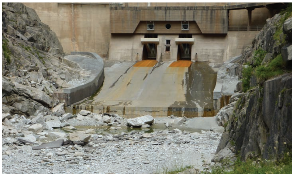
Abb. 2: So sieht es unterhalb der über 100 m hohen Mauer des Stausees Gibidum/VS aus, der das Schmelzwasser des Aletschgletschers fasst und kaum einen Tropfen an den Bach Massa zurückgibt.

Eine maximale Rendite für einen minimalen Ertrag: ein gutes Geschäft! Die Greina-Stiftung setzt sich dafür ein, dass sich das ändert. Bevor die KWKW-Betreiber noch dem letzten Wildbach das Wasser rauben und sich dafür fürstlich bezahlen lassen, müssen alle WKW-Betreiber endlich unsere Bundesverfassung respektie-